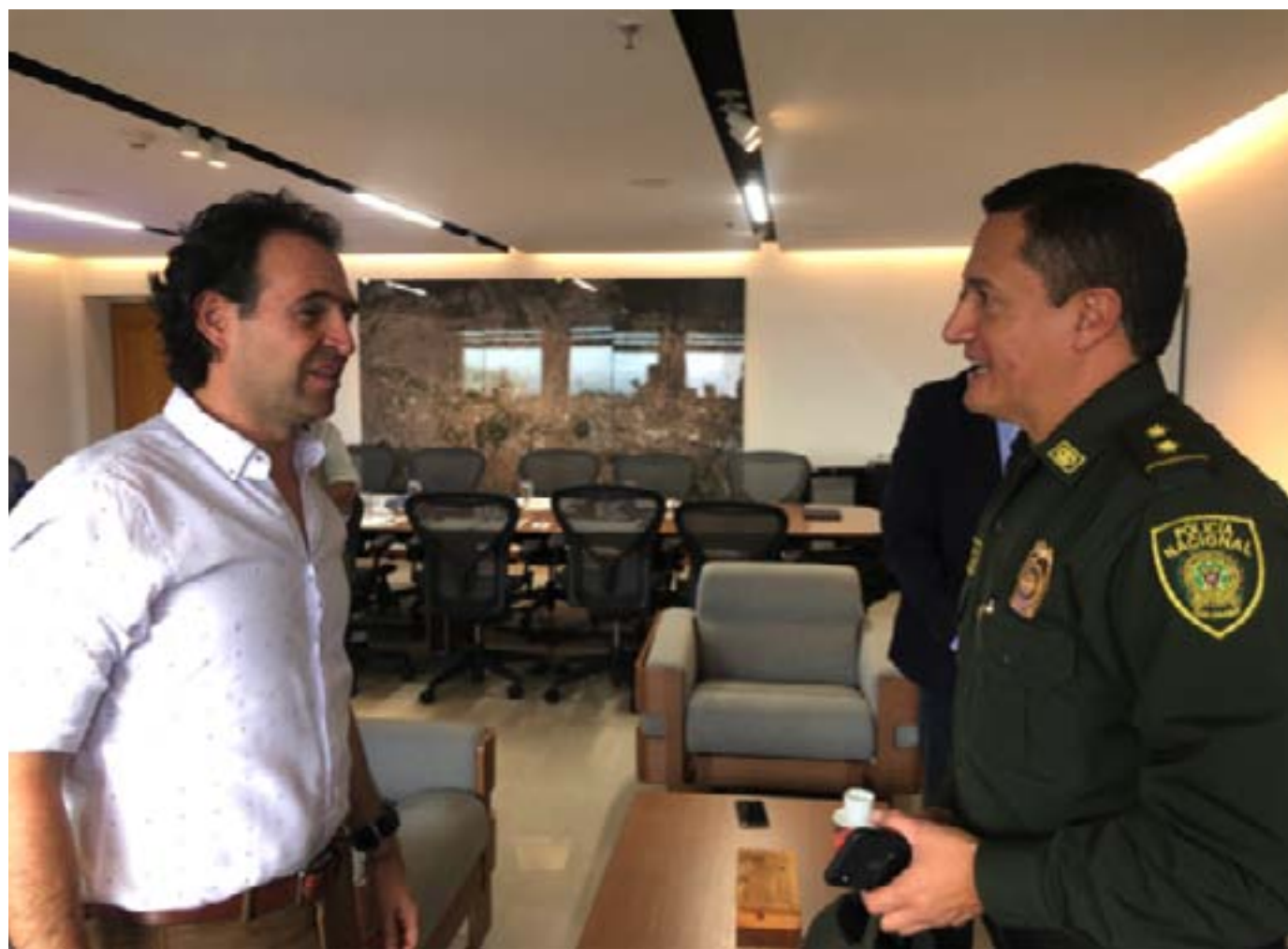
Encuentro con Alcalde de Medellín:

E l Director General del INPEC adelantó una visita a la ciudad de Medellín para reunirse con el alcalde Federico Gutiérrez y altos Funcionarios de esa administración, el encuentro se desarrolló para buscar estrategias que permitan apoyar a la Policía Nacional en la descongestión de las estaciones de Policía.