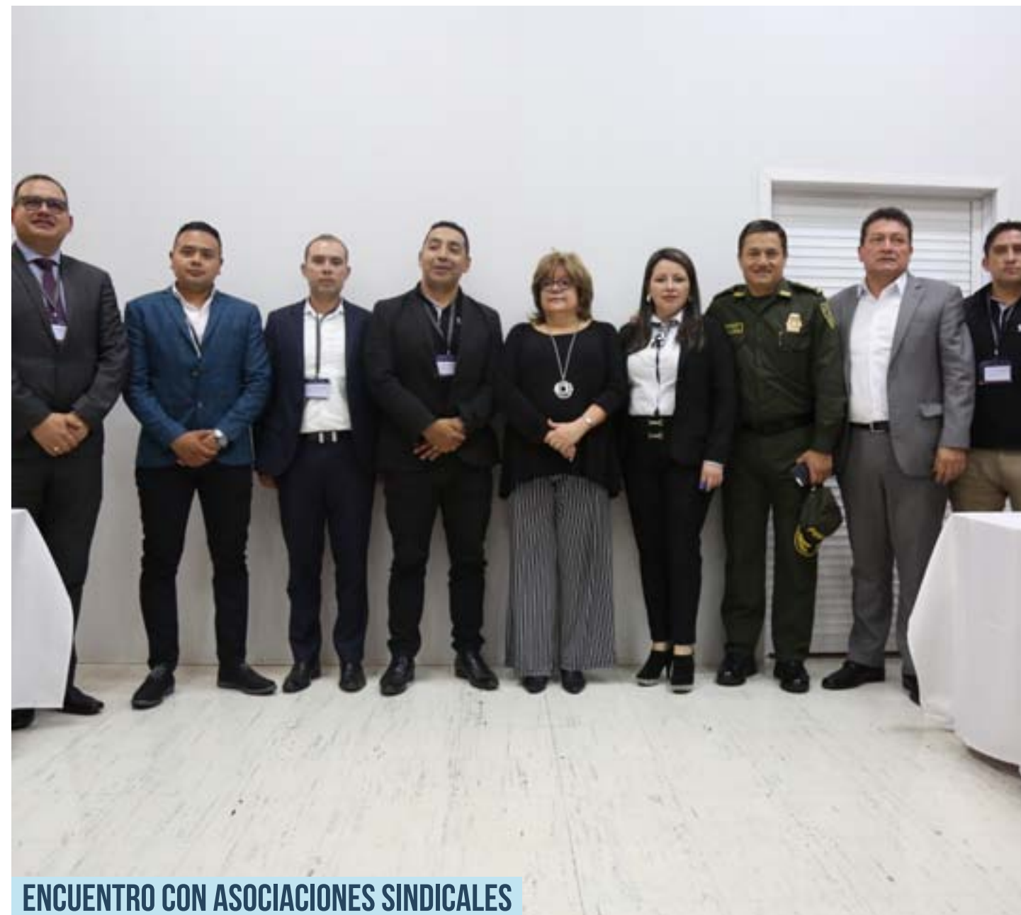
ENCUENTRO CON ASOCIACIONES SINDICALES

Desde el inicio de su administración, el Director del INPEC adelantó el primer acercamiento con las Asociaciones Sindicales, escuchando sus inquietudes y sugerencias frente al Sistema Penitenciario y Carcelario.