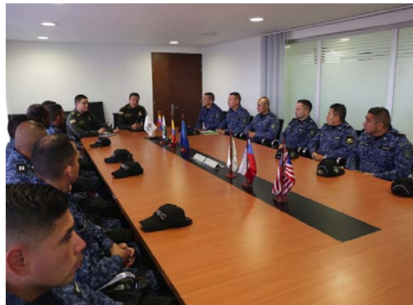
Encuentro cuadros de mando GROPEs :

E l Director General del INPEC adelantó una visita a la ciudad de Medellín para reunirse con el alcalde Federico Gutiérrez y altos Funcionarios de esa administración, el encuentro se desarrolló para buscar estrategias que permitan apoyar a la Policía Nacional en la descongestión de las estaciones de Policía.