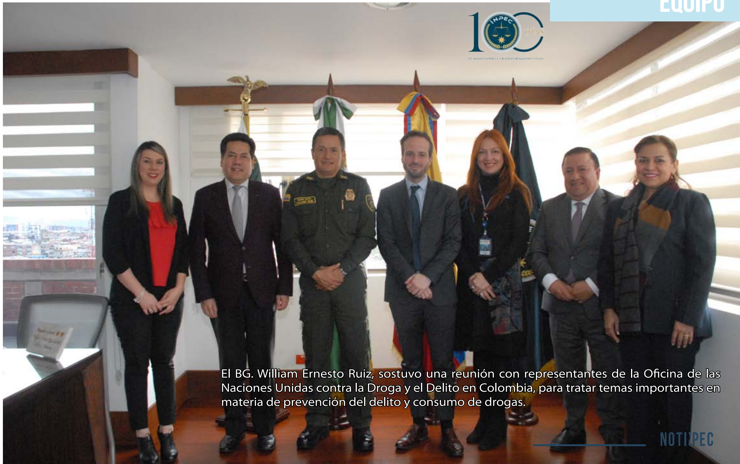
El BG. William Ernesto Ruiz, sostuvo una reunión con representantes de la Oficina de las Naciones Unidas contra la Droga y el Delito en Colombia, para tratar temas importantes en materia de prevención del delito y consumo de drogas.