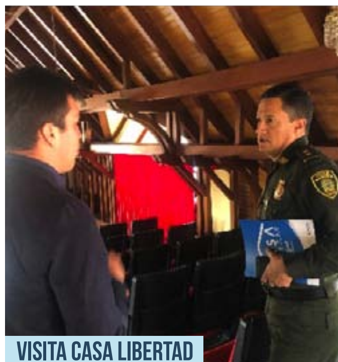
VISITA CASA LIBERTAD

Casa libertad es un lugar donde se brindan segundas oportunidades, y se presta atención personalizada en temas de asesoría jurídica y proyectos de vida y oportunidades laborales.