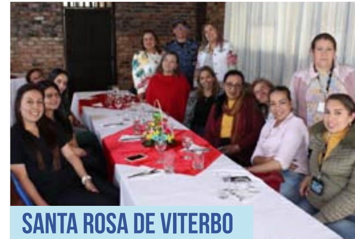
SANTA ROSA DE VITERBO

Con diferentes actividades se llevó a cabo la conmemoración del Día Internacional de la Mujer en los Establecimientos de Reclusión a nivel nacional. Así lo registramos.