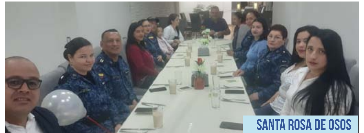
SANTA ROSA DE OSOS