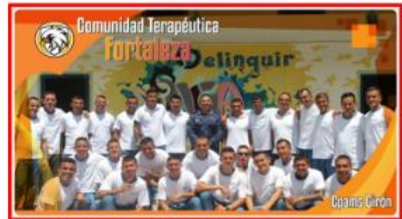
Comunidad Terapéutica Fortaleza CPAMS Girón - Cobertura 35 PPL