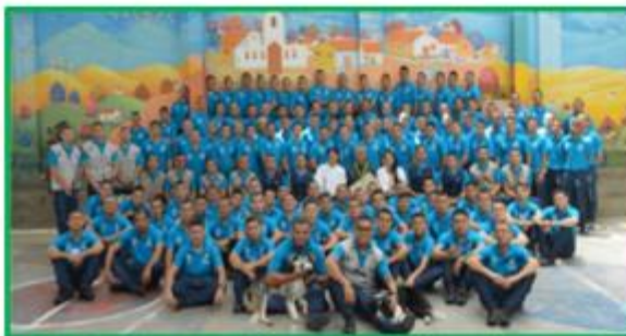
Comunidad Terapéutica Nuevos Horizontes CPMS Bucaramanga - Cobertura 150 PPL