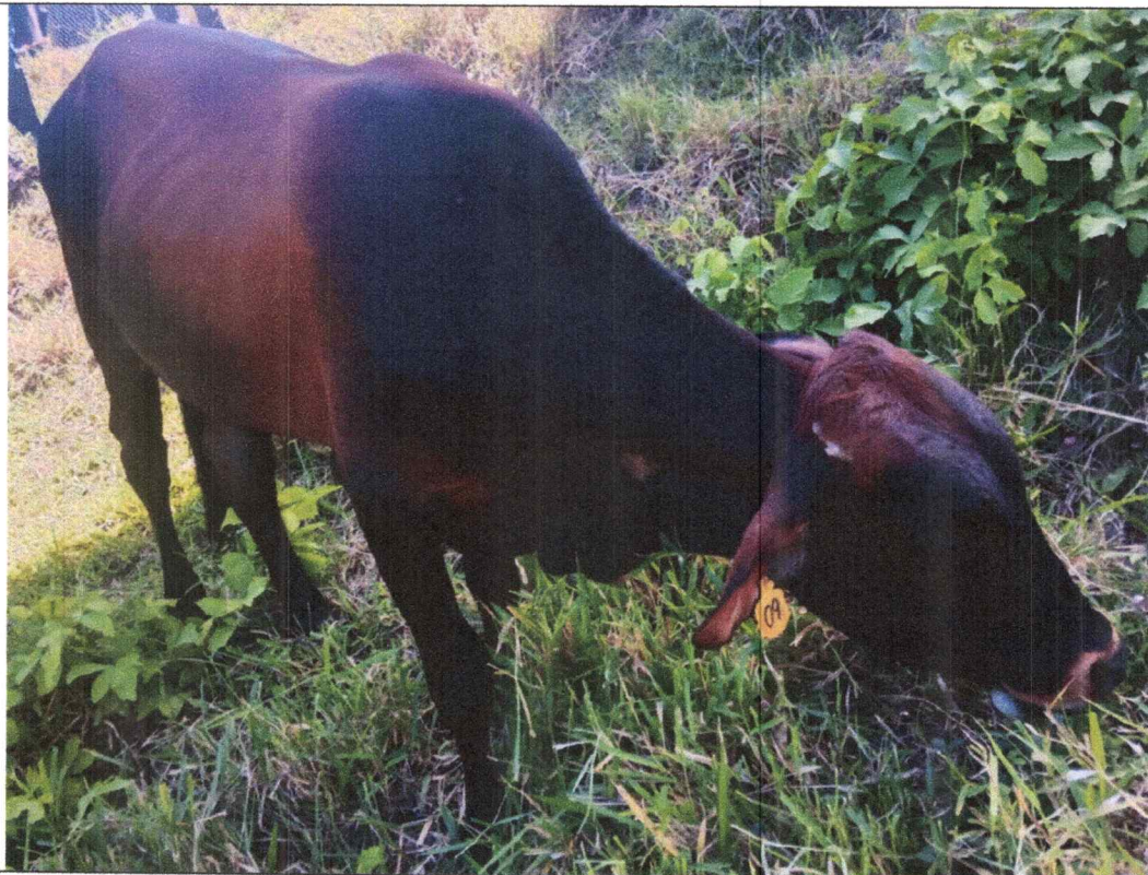
TORETE CRIOLLO NOMBRE PRIMO 420 KILOGRAMOS APROXIMADO