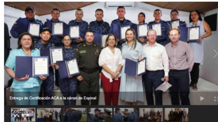
Entrega de Certificación ACA a la cárcel de Espinal

Dirección General Calle 26 No. 27-48 PBX (57+1) 2347474 - Bogotá - Colombia