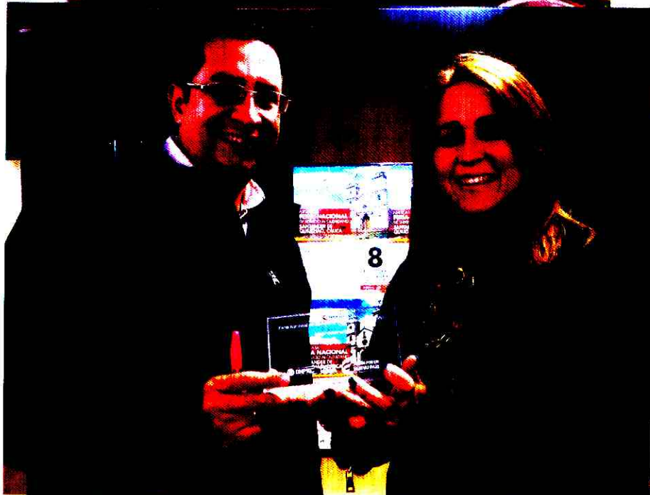
Premio para el INPEC - Participación en la ferias de servicio al ciudadano entregado el 6 de Diciembre por el Departamento Nacional de Planeación DNP .