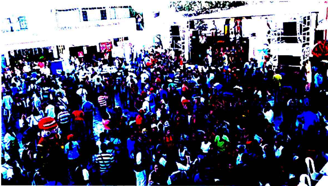
Participación de Feria de servicio al ciudadano Inpec -