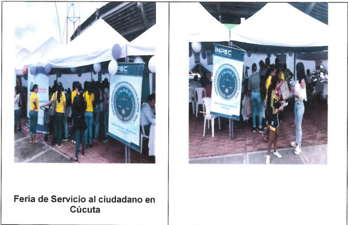
Feria de Servicio al ciudadano en Cúcuta