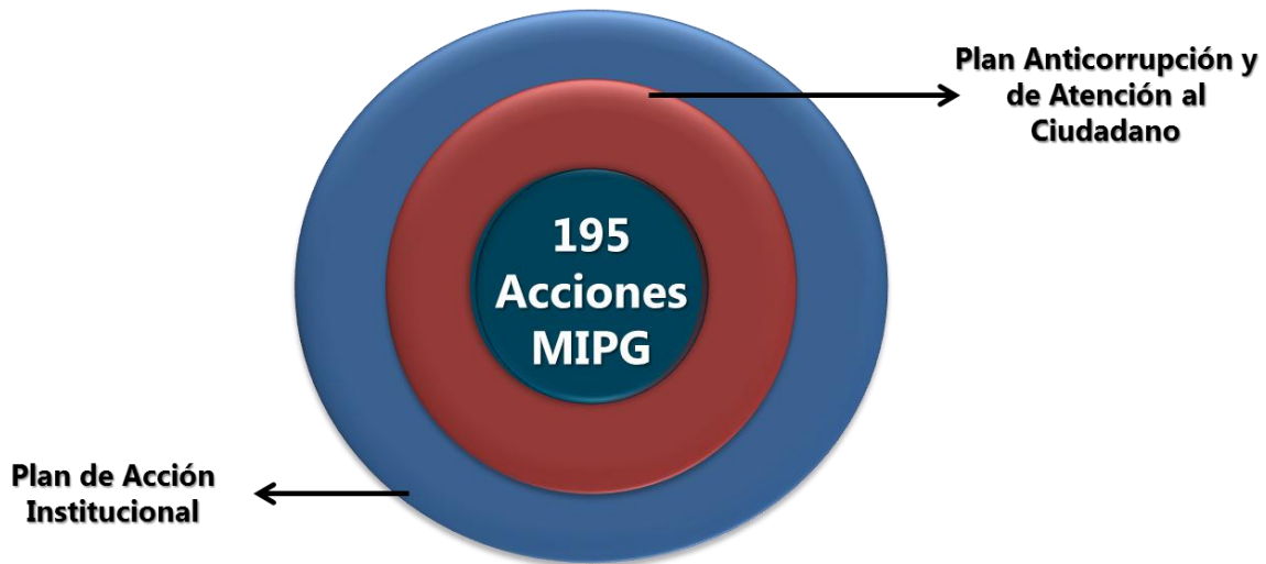
Ilustración 1: Metodología Modelo Integrado de Planeación y Gestión 2018