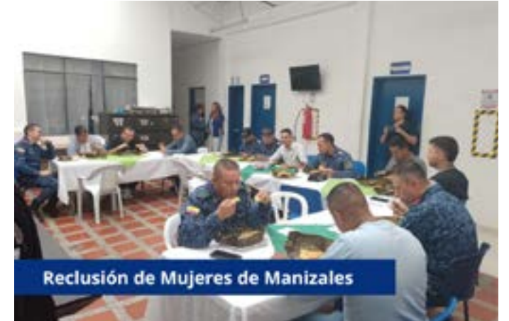
Reclusión de Mujeres de Manizales