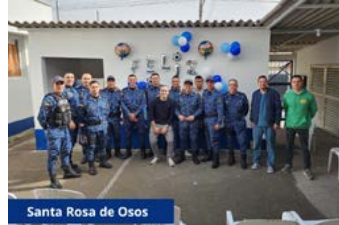
Santa Rosa de Osos