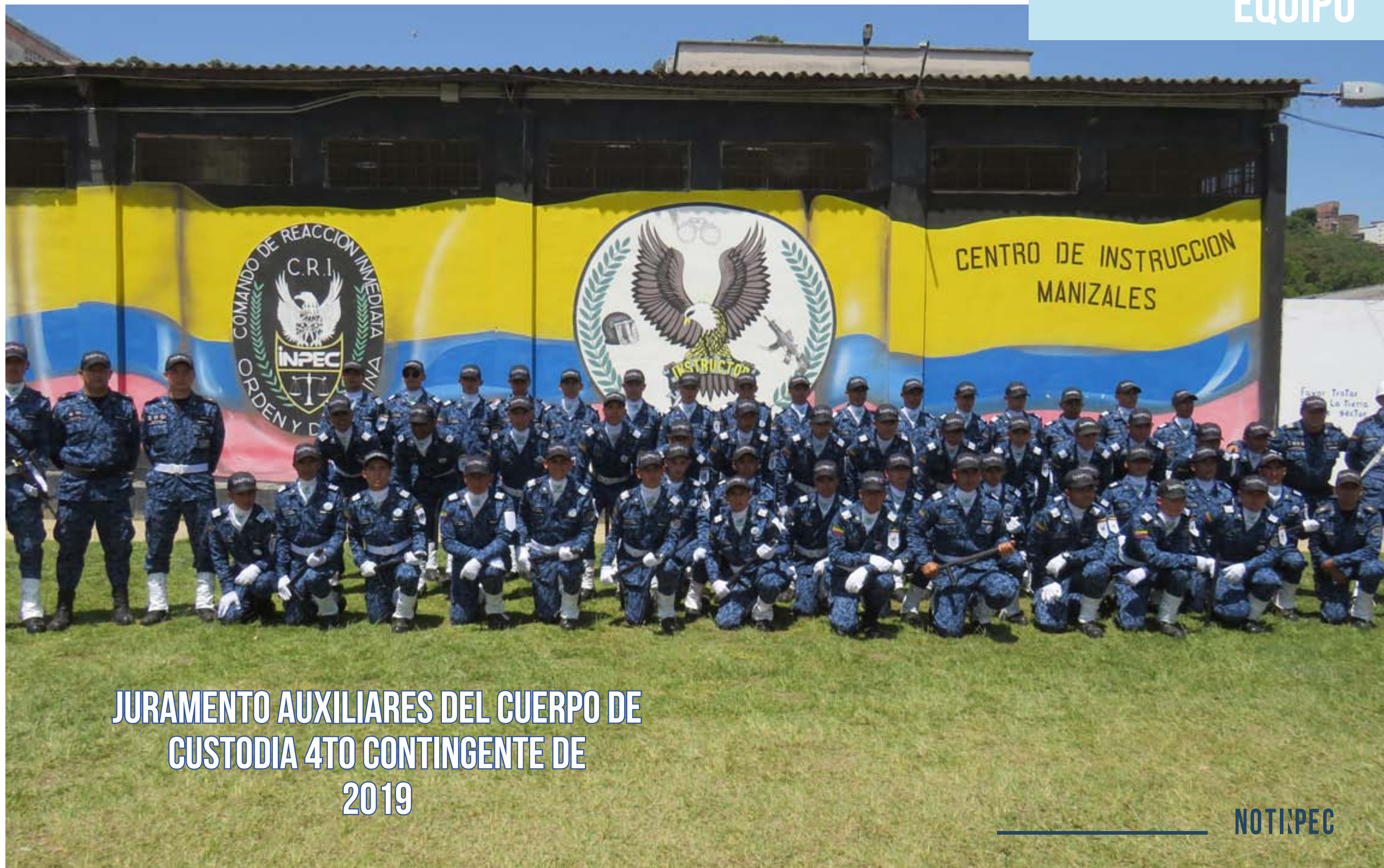
JURAMENTO AUXILIARES DEL CUERPO DE CUSTODIA 4TO CONTINGENTE DE 2019