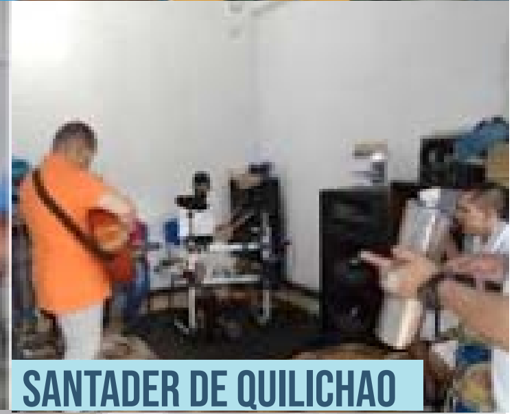
SANTADER DE QUILICHAO