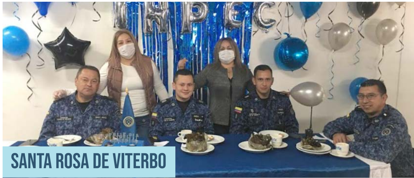
SANTA ROSA DE VITERBO