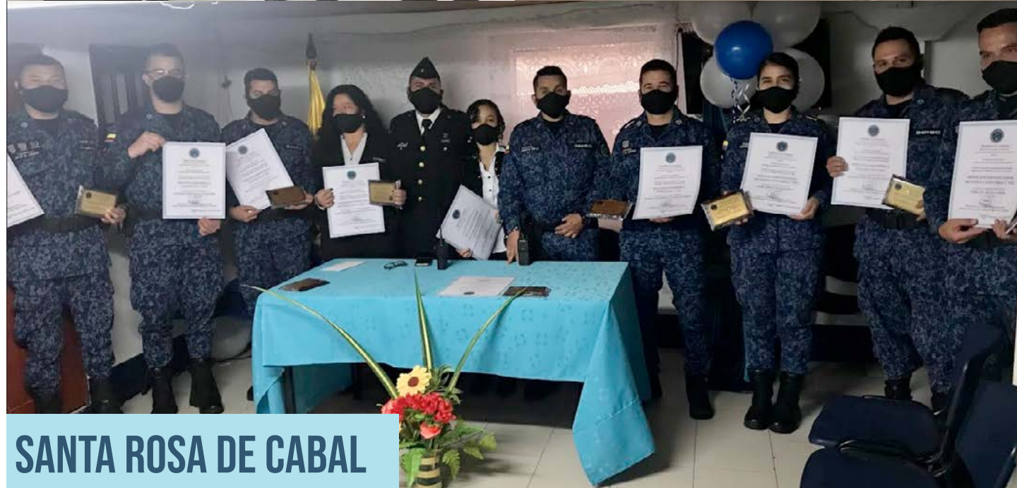
SANTA ROSA DE CABAL