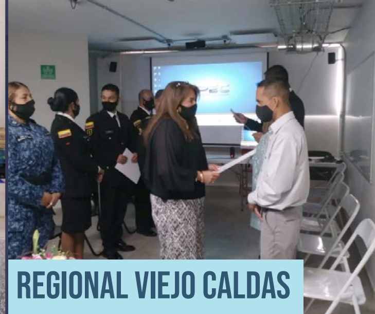
REGIONAL VIEJO CALDAS