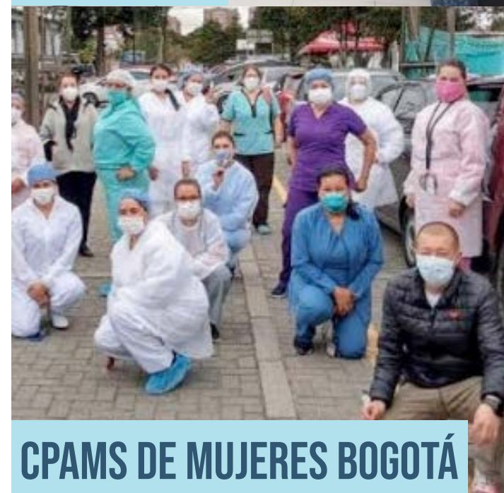
CPAMS DE MUJERES BOGOTÁ