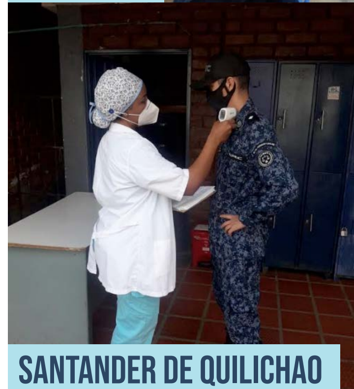
SANTANDER DE QUILICHAO