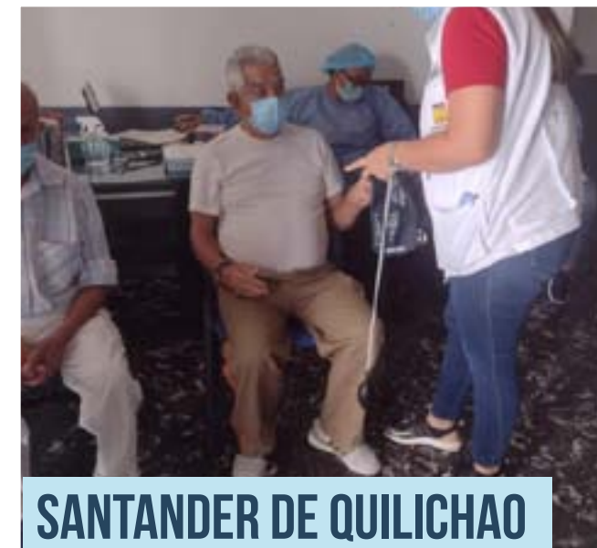
SANTANDER DE QUILICHAO