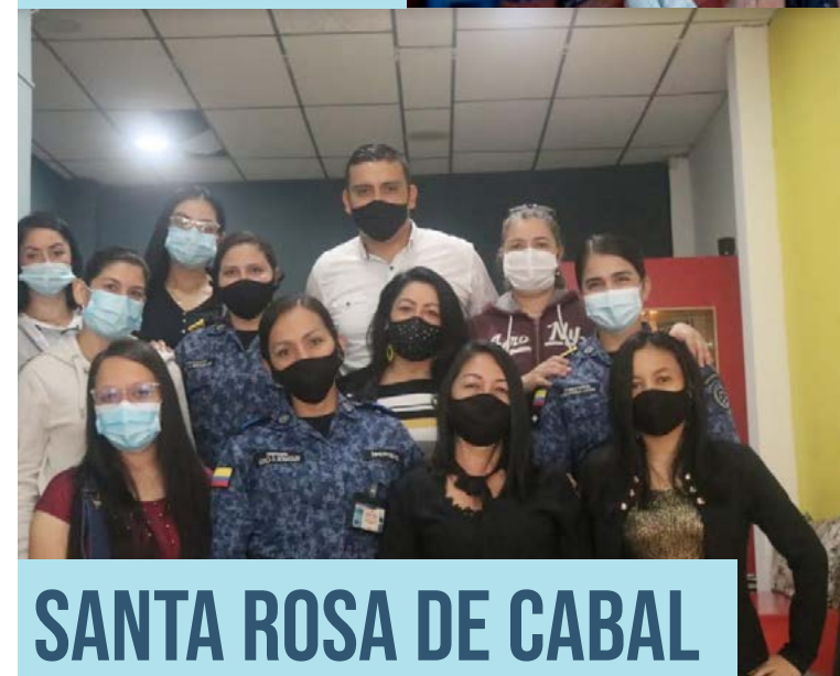
SANTA ROSA DE CABAL