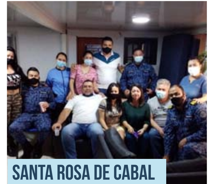
SANTA ROSA DE CABAL