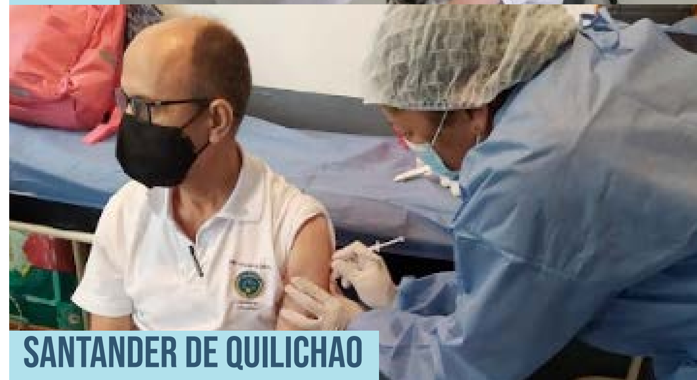
SANTANDER DE QUILICHAO