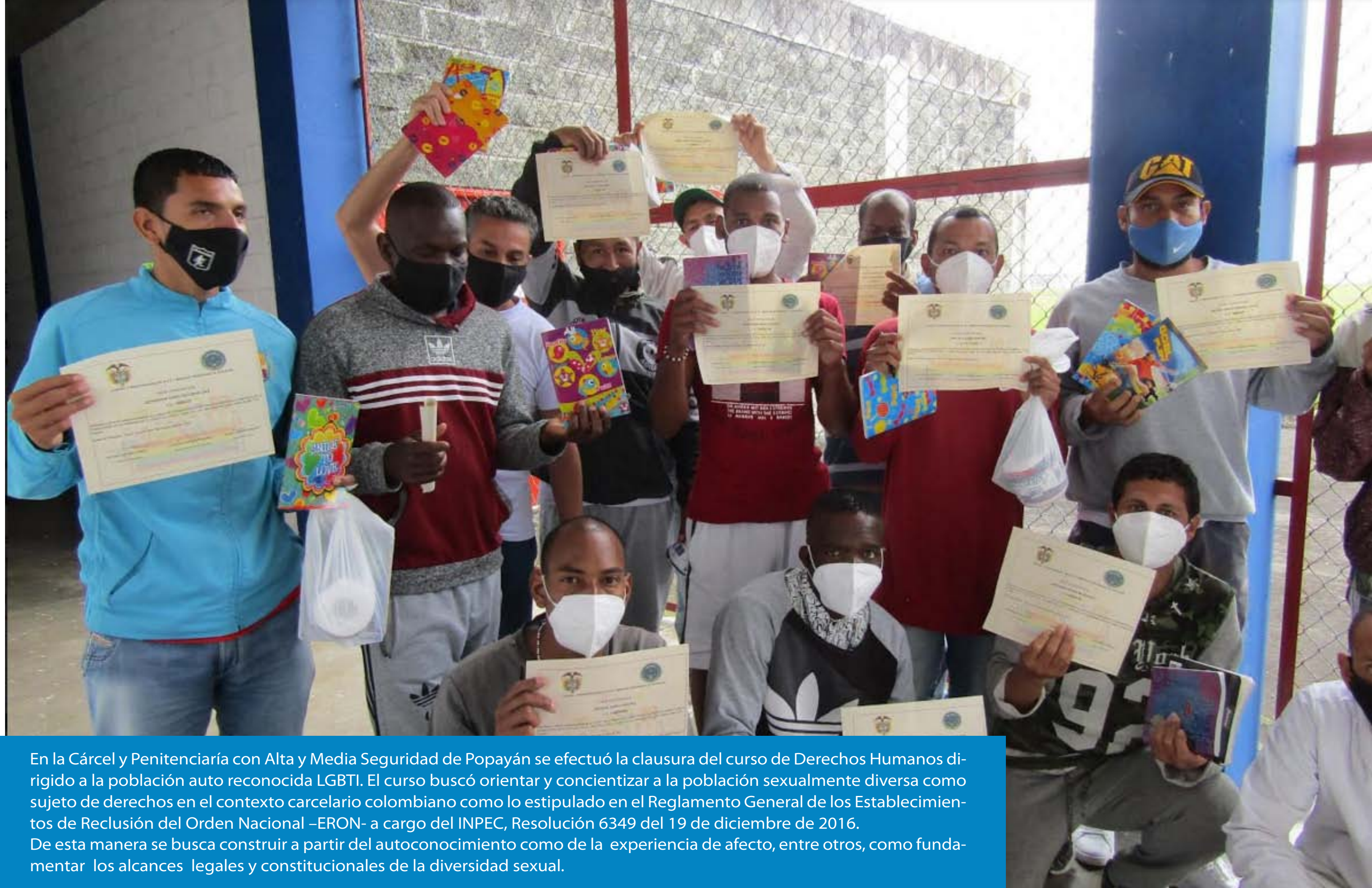
En la Cárcel y Penitenciaría con Alta y Media Seguridad de Popayán se efectuó la clausura del curso de Derechos Humanos dirigido a la población auto reconocida LGBTI. El curso buscó orientar y concientizar a la población sexualmente diversa como sujeto de derechos en el contexto carcelario colombiano como lo estipulado en el Reglamento General de los Establecimientos de Reclusión del Orden Nacional –ERON- a cargo del INPEC, Resolución 6349 del 19 de diciembre de 2016. De esta manera se busca construir a partir del autoconocimiento como de la experiencia de afecto, entre otros, como fundamentar los alcances legales y constitucionales de la diversidad sexual.