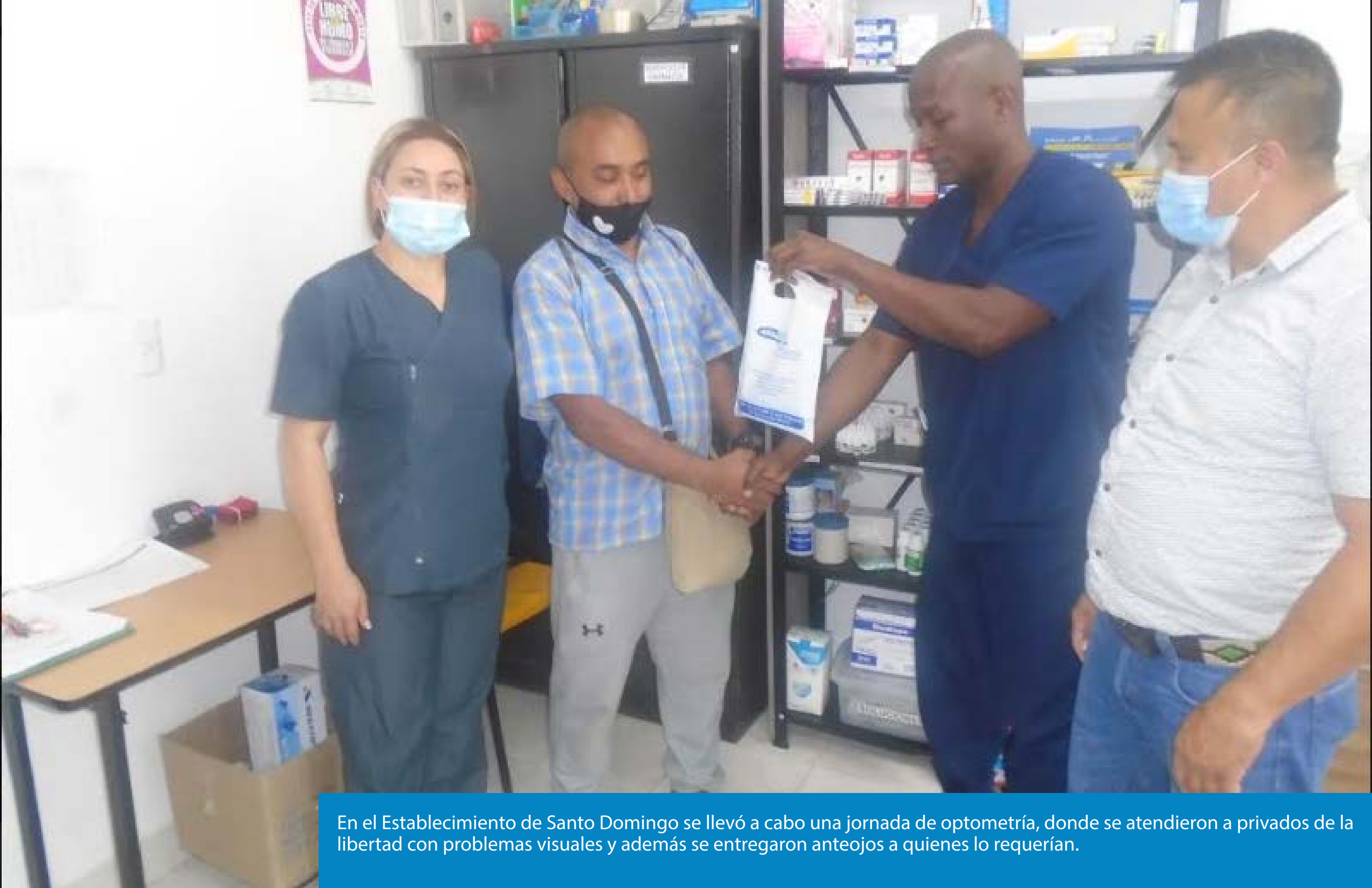
En el Establecimiento de Santo Domingo se llevó a cabo una jornada de optometría, donde se atendieron a privados de la libertad con problemas visuales y además se entregaron anteojos a quienes lo requerían.