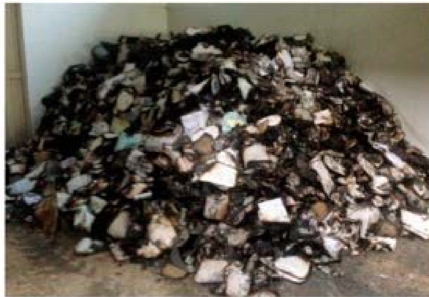
La acción nociva de las llamas en los archivos