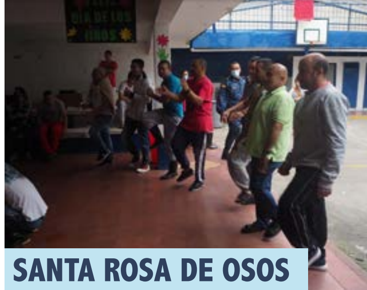
SANTA ROSA DE OSOS