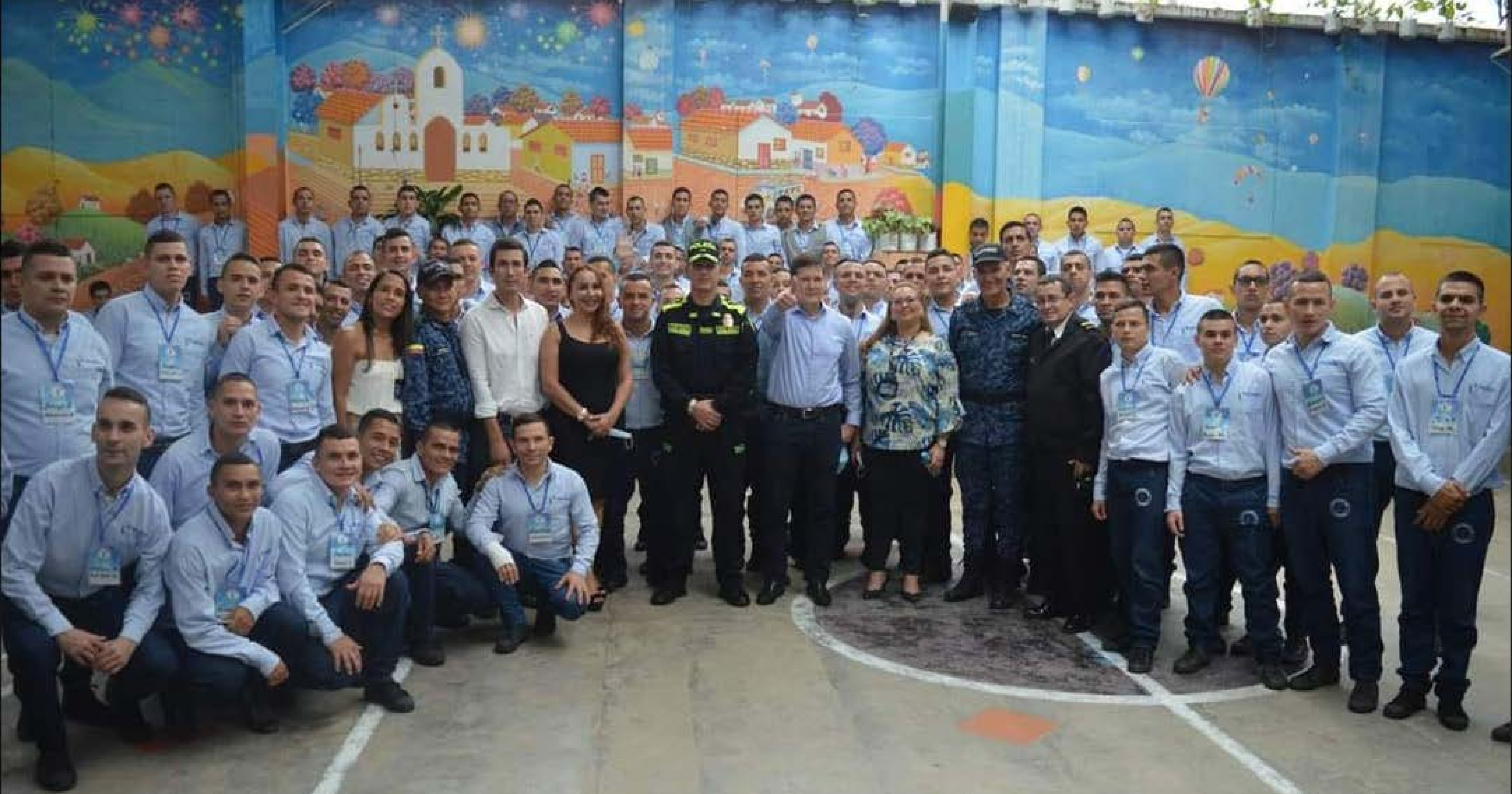
El Ministro de Justicia y del Derecho Wilson Ruiz Orejuela, visitó la Cárcel y Penitenciaría de Mediana Seguridad de Bucaramanga, con el acompañamiento de la Secretaría del Interior de la Alcaldía y la Dirección Regional Oriente con el fin de conocer los procesos de resocialización del ERON.