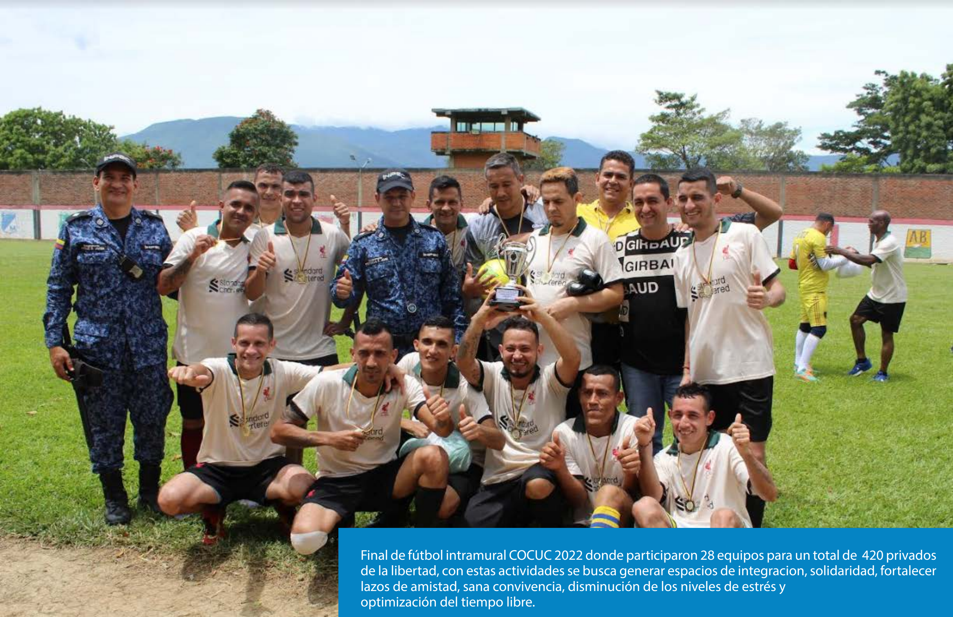
Final de fútbol intramural COCUC 2022 donde participaron 28 equipos para un total de 420 privados de la libertad, con estas actividades se busca generar espacios de integración, solidaridad, fortalecer lazos de amistad, sana convivencia, disminución de los niveles de estrés y optimización del tiempo libre.