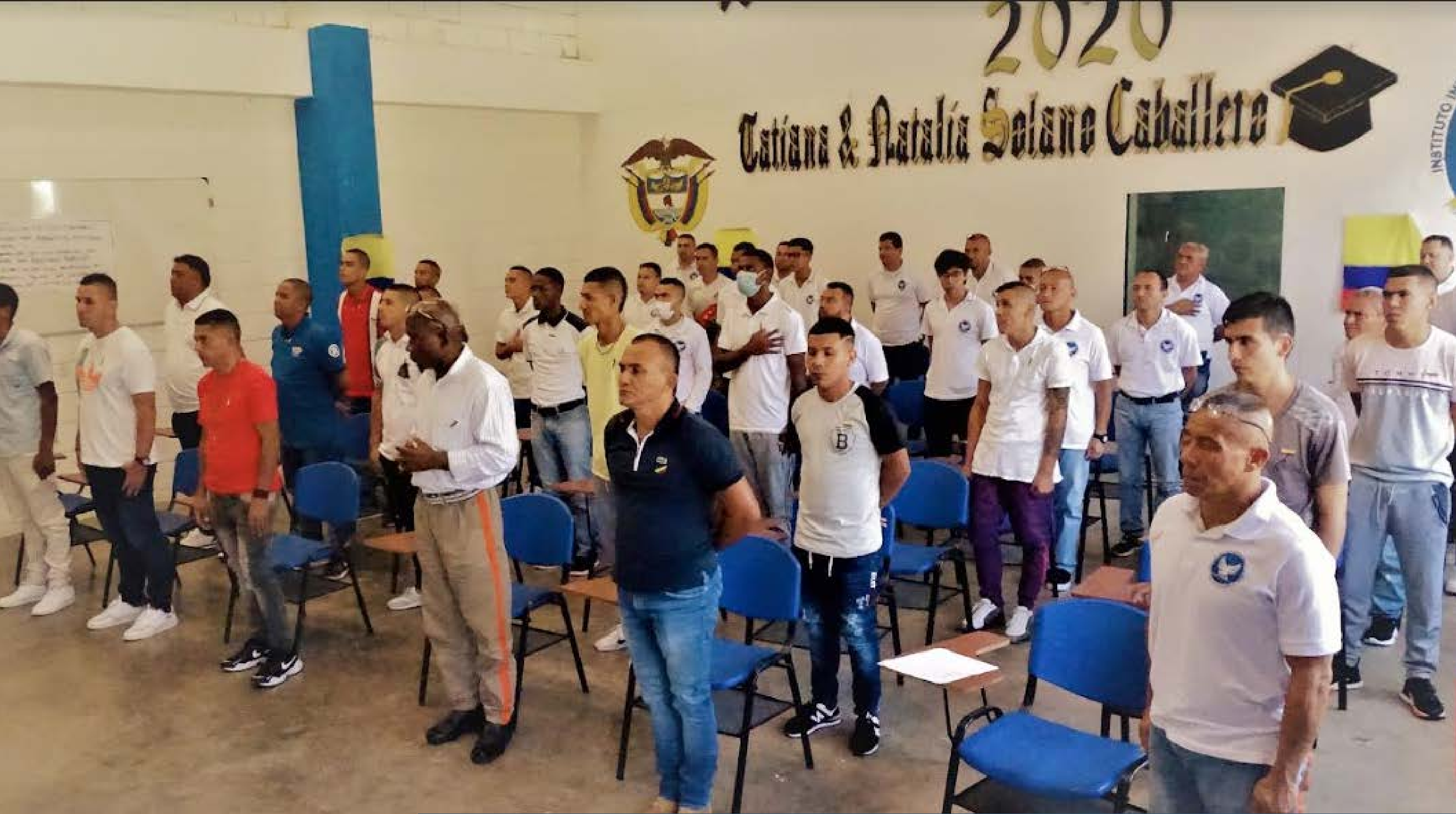
Con el apoyo del área de educativas de la CPAMS de Girón se llevó a cabo la Izada de Bandera en conmemoración al Día de la Independencia, donde participaron los privados de la libertad que estudian en el Instituto Integrado Enrique Low Murtra.