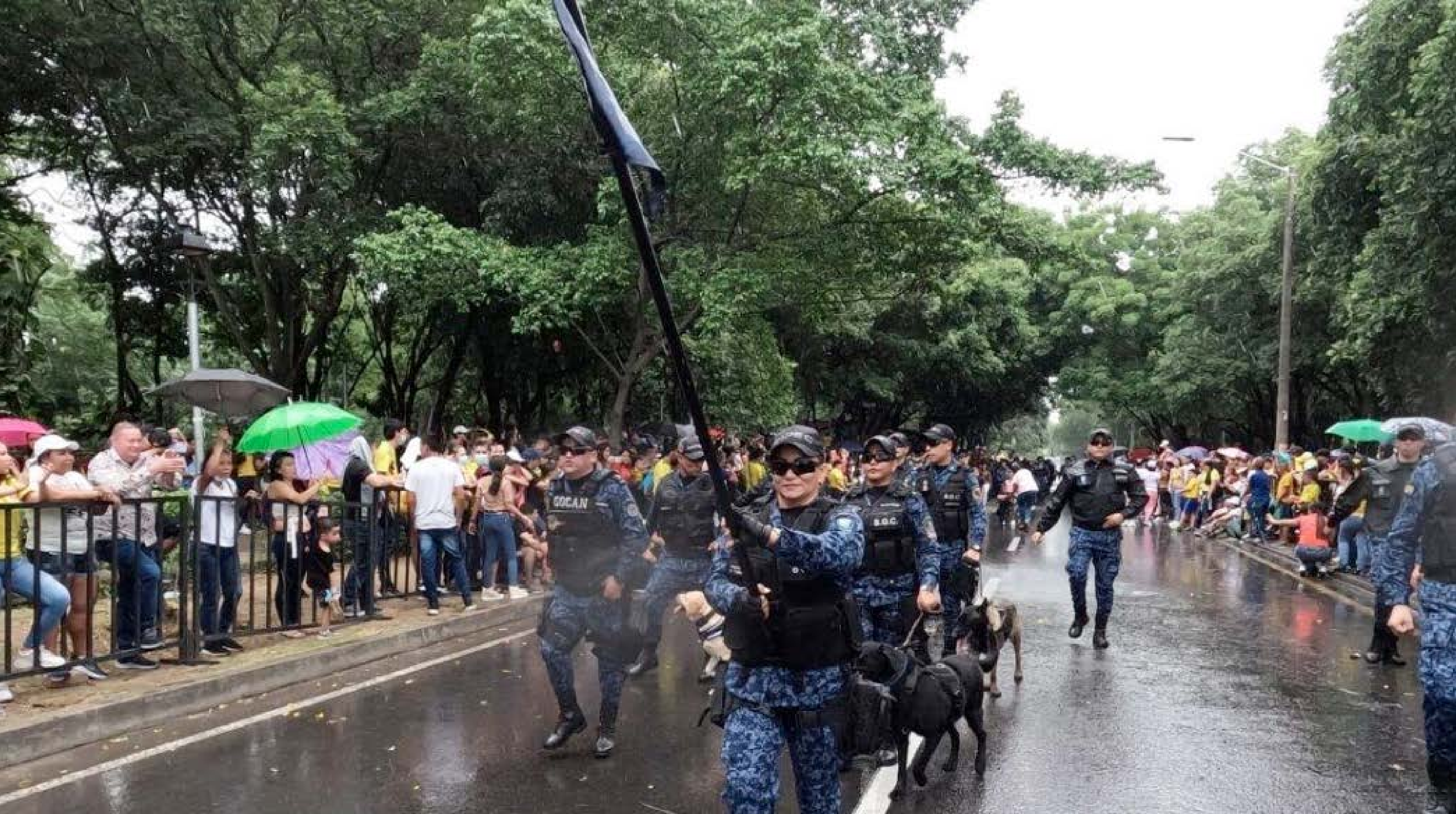
En representación del Complejo Carcelario de Cúcuta funcionarios del Cuerpo de Custodia y Vigilancia, participaron del tradicional Desfile del 20 de Julio que se llevó a cabo en la capital norte santandereana.