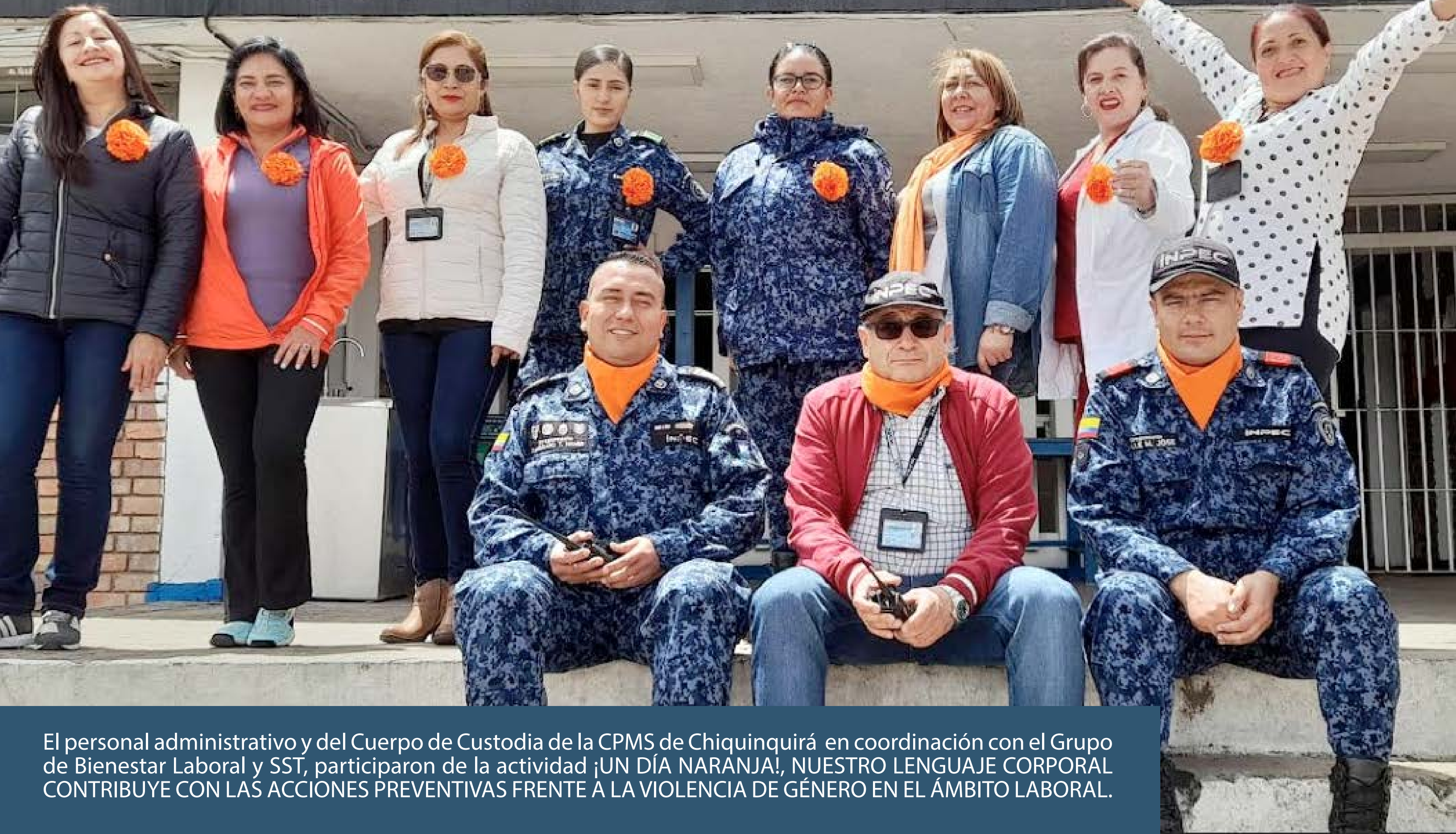
El personal administrativo y del Cuerpo de Custodia de la CPMS de Chiquinquirá en coordinación con el Grupo de Bienestar Laboral y SST, participaron de la actividad ¡UN DÍA NARANJA!, NUESTRO LENGUAJE CORPORAL CONTRIBUYE CON LAS ACCIONES PREVENTIVAS FRENTE A LA VIOLENCIA DE GÉNERO EN EL ÁMBITO LABORAL.