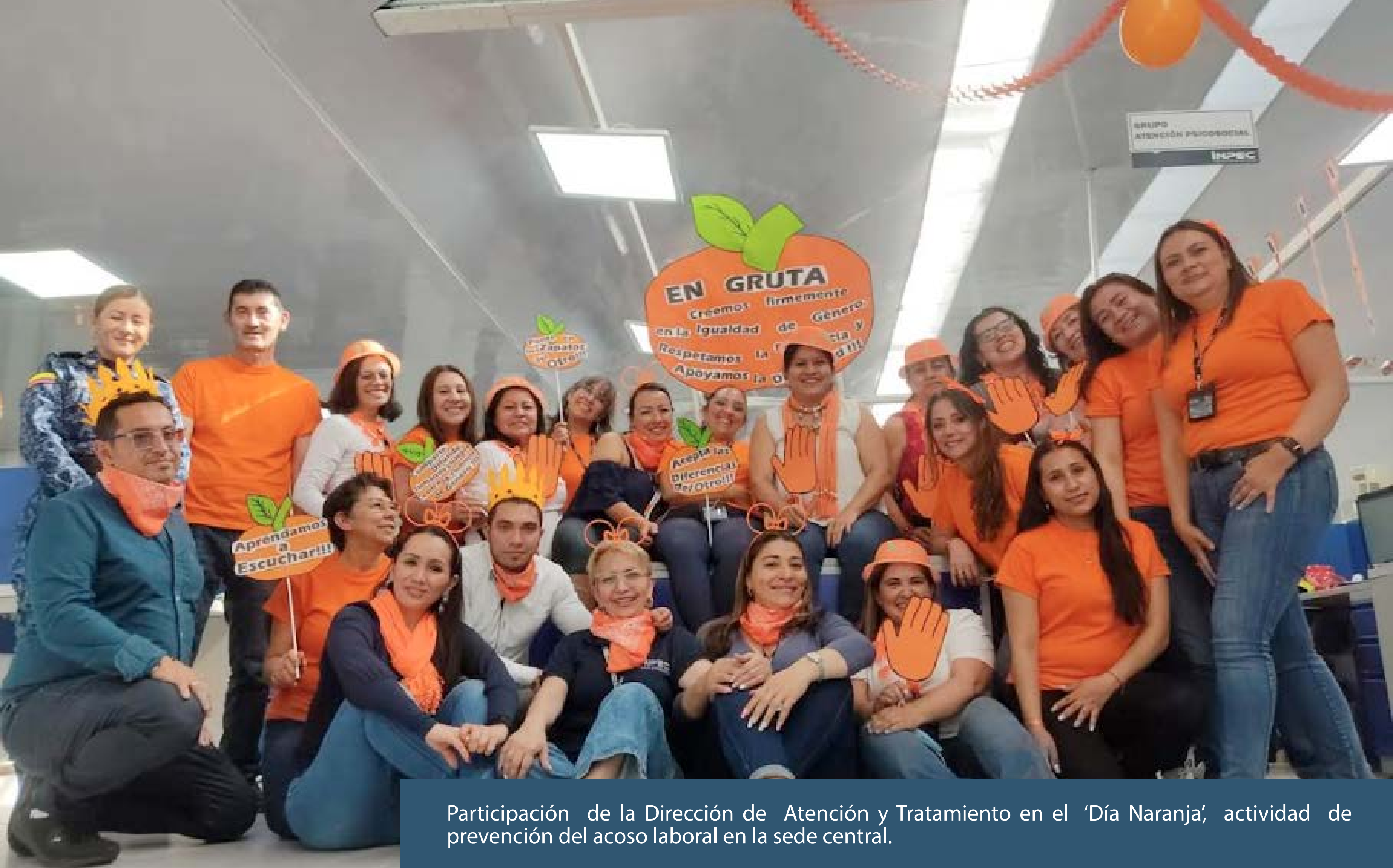
Participación de la Dirección de Atención y Tratamiento en el 'Día Naranja', actividad de prevención del acoso laboral en la sede central.