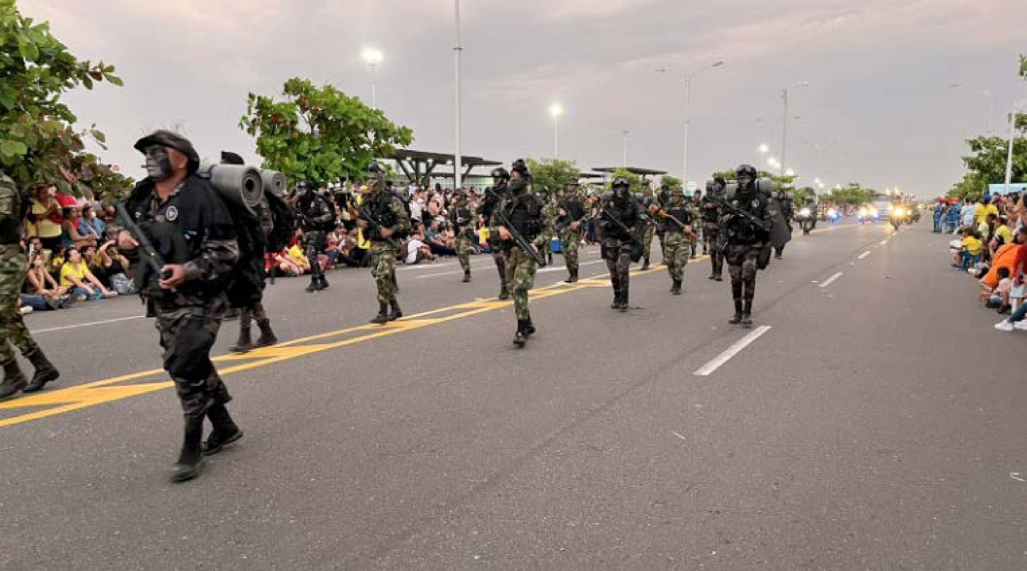
Los Grupos Especiales del INPEC participaron en el Desfile del 20 de Julio que se llevó a cabo en la Avenida 40 y Malecón de Barranquilla.