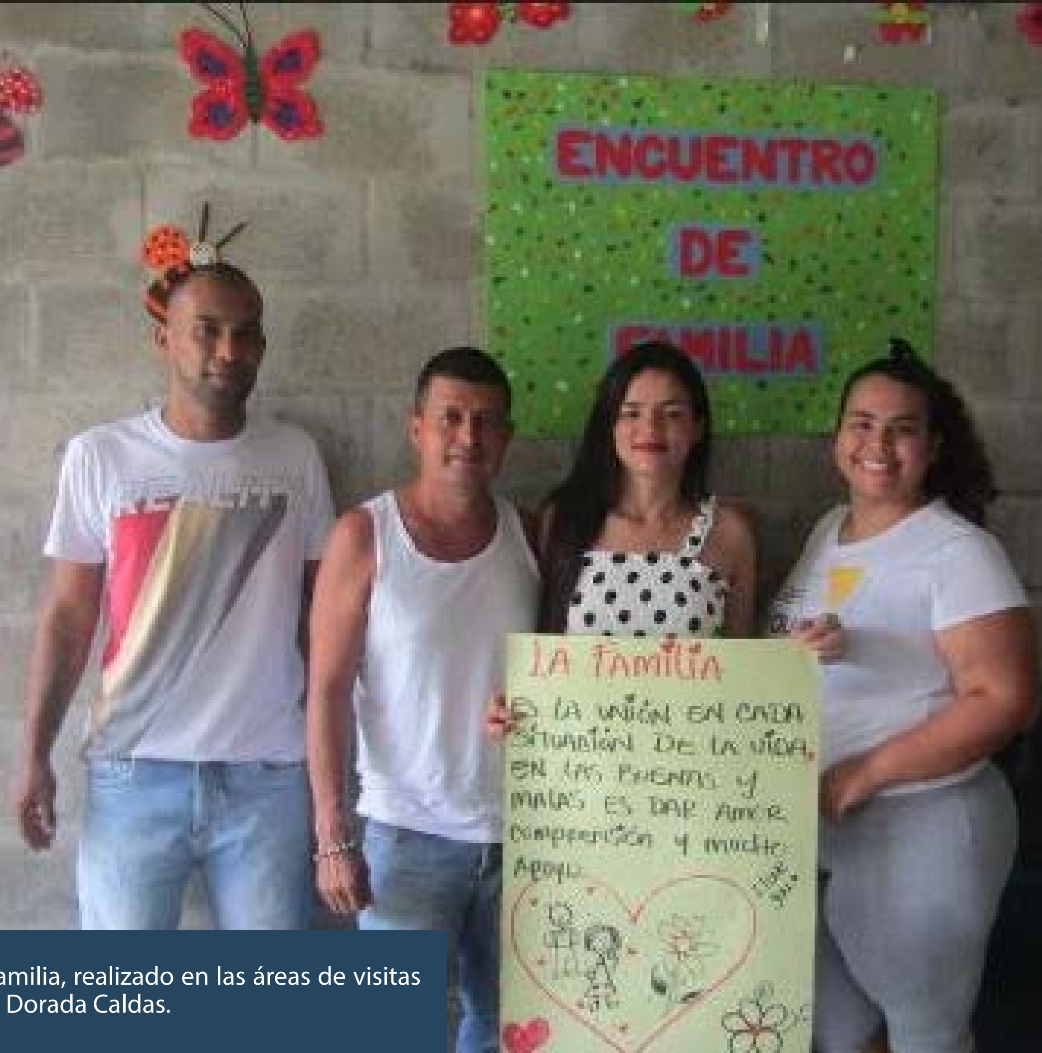
Primer encuentro de familia, realizado en las áreas de visitas 1, 2, 3 de la CPAMS - La Dorada Caldas.