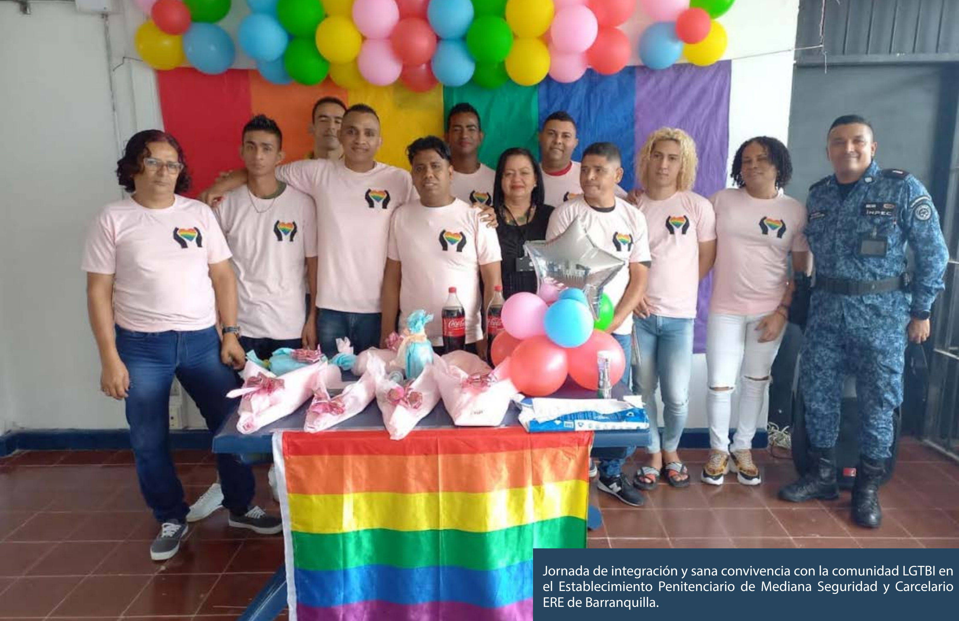
Jornada de integración y sana convivencia con la comunidad LGTBI en el Establecimiento Penitenciario de Mediana Seguridad y Carcelario ERE de Barranquilla.