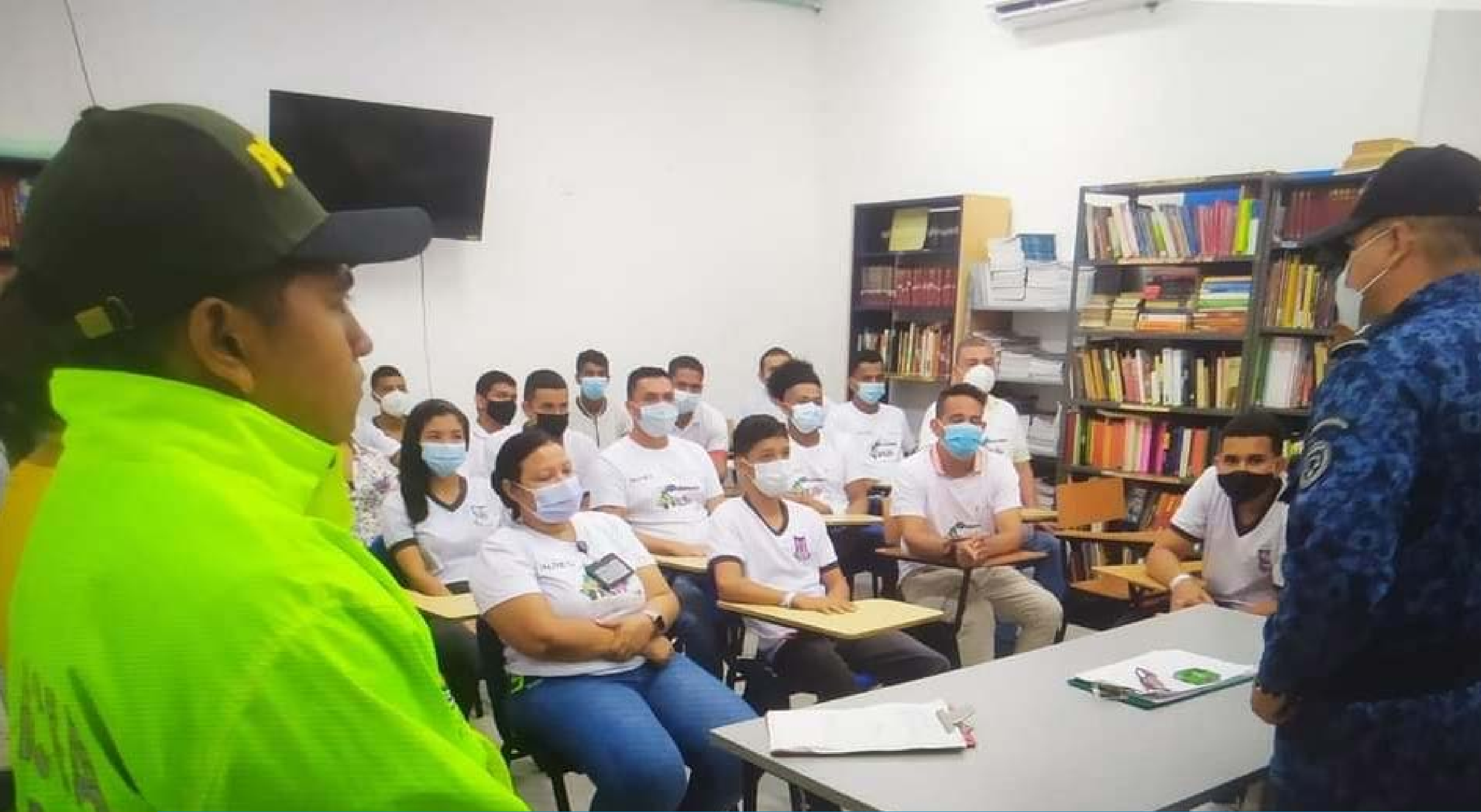
Desarrollo del programa teórico-práctico del programa 'Delinquir no Paga, Yo le Apuesto a lo Legal', al interior del Establecimiento Penitenciario de Mediana Seguridad y Carcelario de Puerto Berrio. Dando inicio con jóvenes pertenecientes a la institución educativa América.