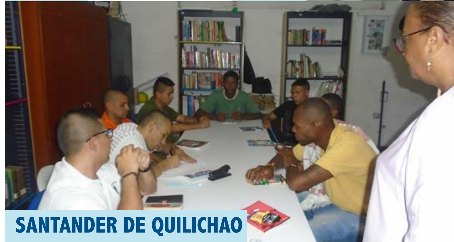
SANTANDER DE QUILICHAO