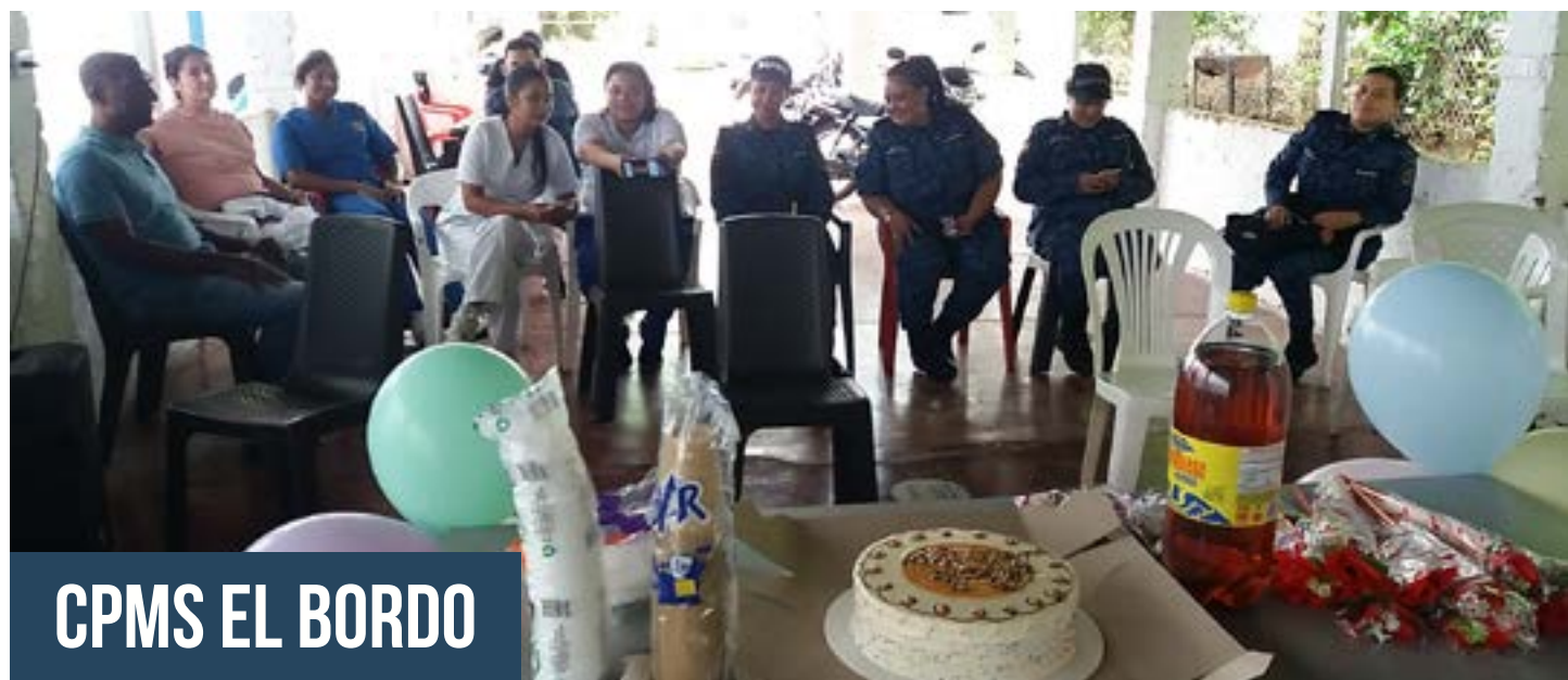
CPMS EL BORDO

INPEEC Instituto Nacional Penitenciario y Carcelario