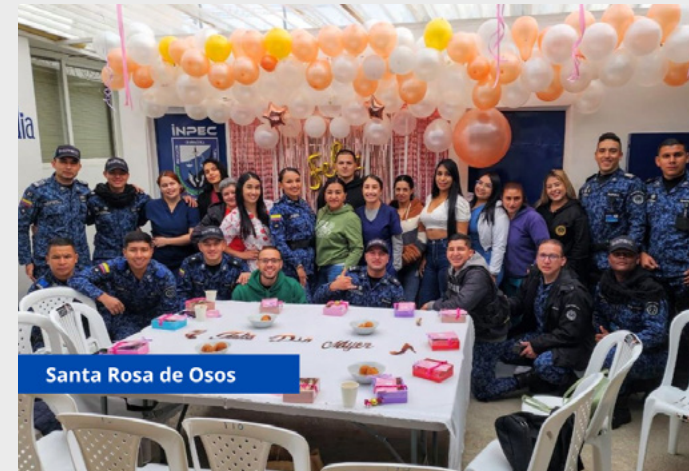
Santa Rosa de Osos