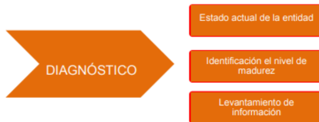
Figura 2 – Etapas previas a la implementación