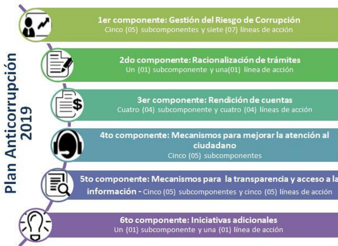
Figura 1. Estructura Plan Anticorrupción y Atención al Ciudadano 2019

El INPEC, frente a su lucha contra la corrupción y gestión eficiente y transparente, implementa en la planeación estratégica los lineamientos establecidos por la Secretaría de Transparencia de la Presidencia de la República y el DAFP, en la guía “Estrategias para la construcción del Plan Anticorrupción y de Atención al Ciudadano versión 2”, y define por su parte la siguiente estructura para el plan, así: