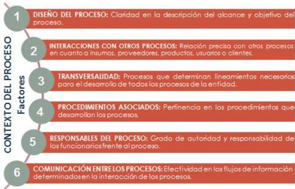
Figura 5. Factores que componen el contexto del proceso Fuente: Oficina Asesora de Planeación

La construcción del riesgo de corrupción, busca identificar los riesgos de corrupción inherentes al desarrollo de las actividades propias de Instituto. Para la identificación de los riesgos de corrupción, es importante verificar previamente si en la descripción del riesgo concurren todos los componentes de su definición, los