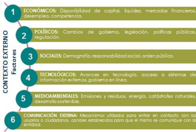
Figura 3. Factores que componen el contexto externo

En el análisis del contexto externo se tienen en cuenta los siguientes factores: