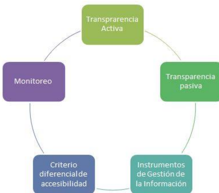
Figura 7. Subcomponente de Transparencia y Acceso a la Información Pública

Para dar cumplimiento la guía señala cinco (5) estrategias generales que el Instituto adoptará con el propósito de Transparencia y el Acceso a la Información Pública, definiéndolas en los siguientes subcomponentes: