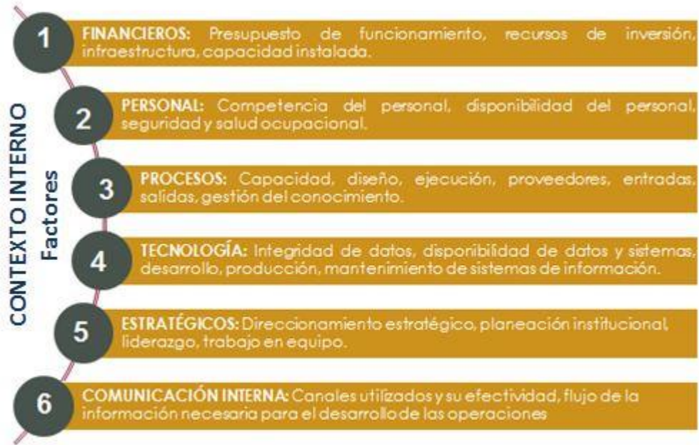
Figura 4. Factores que componen el contexto interno