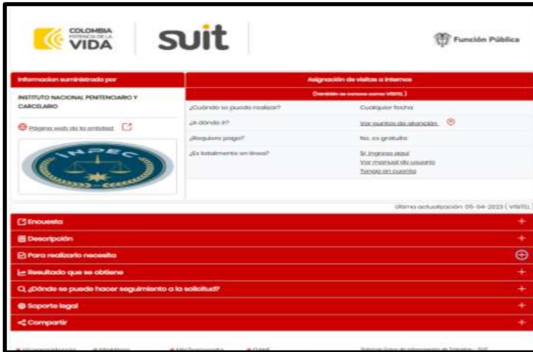
Imagen No. 02 Información OPA “Asignación de visitas a internos” página gov.co